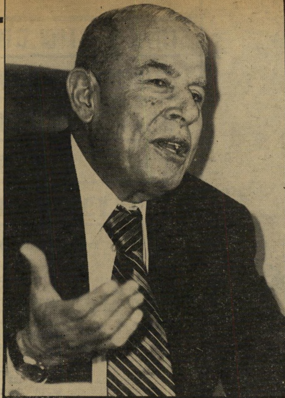
יו"ר פרלמנט לשעבר אל-מצרי, האוטונומיה היא בידון לבני-אדם"