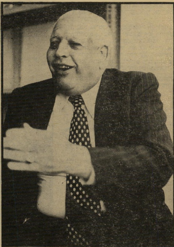
חבר-פרלמנט לשעבר פארס, עד שיחזירו את אל-עריש, אני לא מאמין..."