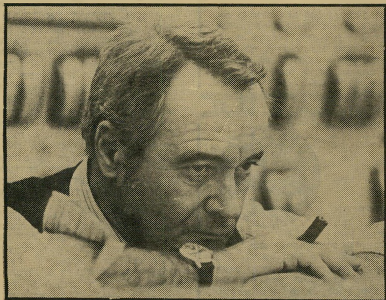
ג'ק למון בתפקיד המהנדס המתוסכל שיבה מוצלחת לברודוויי

הנבואה קרמה עור וגידים. לפי ני המיקרה התוכחו באם יצרכו לפנות את מדינת פנסילבניה במידה שהדליפה