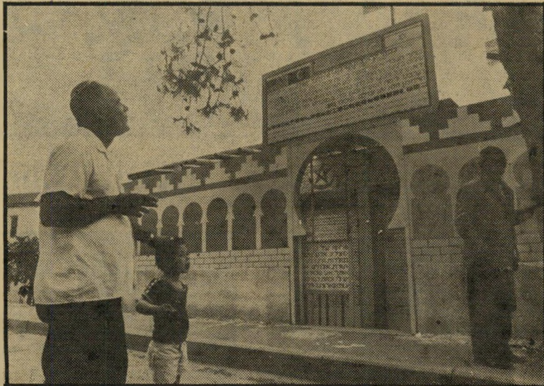
תבול ליד בית-כנסת השלום

בית-הכנסת צבוע ורוד ותכלת. על ה" מניין סטראופוני