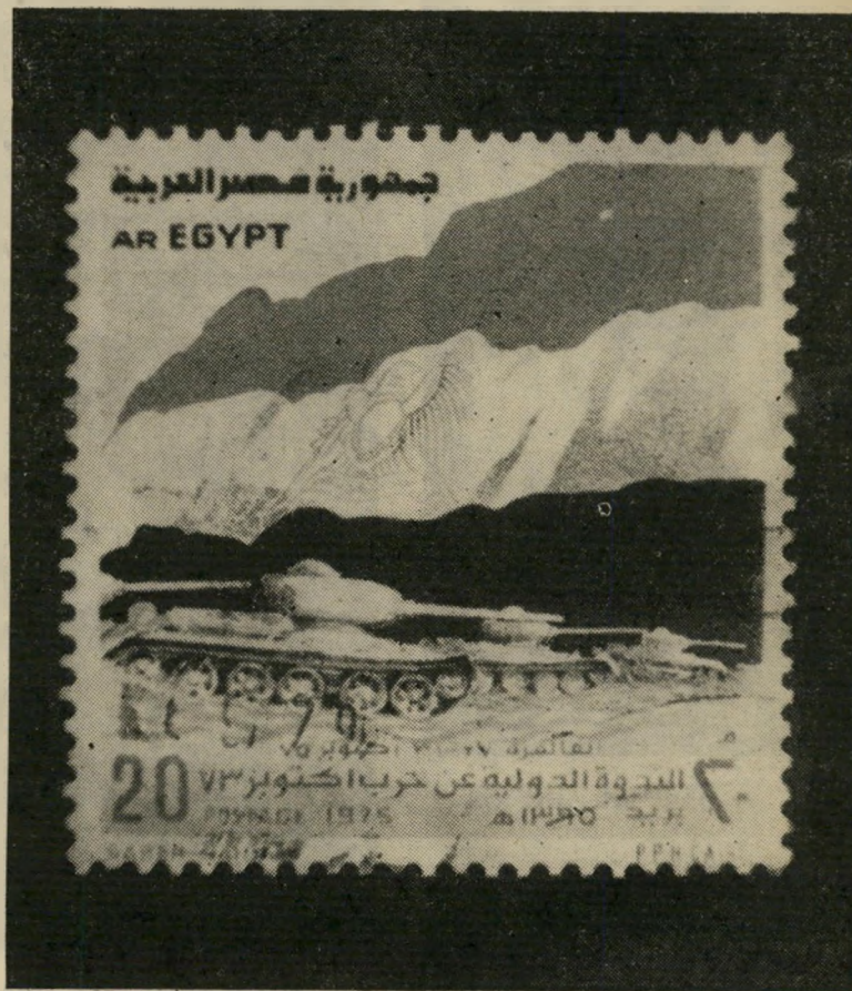
21. זיכרון יום-הכיפורים הכבוד וחזור

עבד-אל-נאצר עצמו דבק בשם "הרפוב" ליקה הערבית המאוחדת" ובדגלה בעל שני הכוכבים, אף שהפכו סמלים ריקים ומביכים. הוא לא היה יכול להשלים עם כישלונו האישי במלחמת יוני 1967, ועם