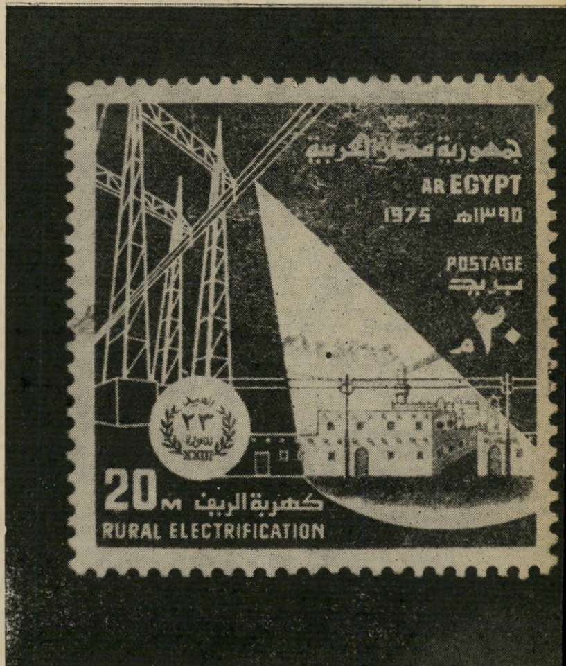
23. שיכון מצריים חישמול הכפר

בול-זיכרון אחר, שהודפס במלאת שנתיים למיבצע, מראה את הדגל המתנופף (שבו הפס הנשר את מקומם של שני הכוכבים של הרפובליקה המאוחדת) מעל לטאנקים שועטים (בול 21).