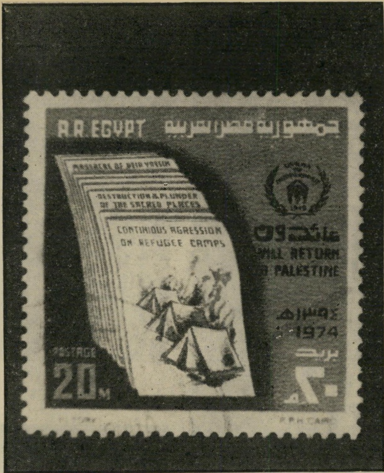
22. דירי'אסין והפצצת המחנות בלבנון (1974) הרס ושוד המקומות הקדושים

אין ספק כי גאות מצריים על חציית התעלה הכשירה את הקרקע ליוזמת השלום הגדולה, שבאה אחריה. אך המאבק בי נשמה המצרית לא היה קל. בול משנת 1974 מוקדש לפלסטין, ומתנוססת עליו הסיסמה "נשוב" (בערבית) ו"אנחנו נשוב לפלסטין" (באנגלית). צרור של דפים מר"א אה את חטאי ישראל, החל ב"טבח דירי'אסין" דרך "הרס ושוד המקומות הקדושים" ועד "התקפות המתמשכות נגד מח"נות הפליטים" (בול 22). ואילו בול אחר, כעבור כמה חודשים, מוקדש כולו לשיי קומה של מצריים ולבניינה, ונושא את ה"סיסמה "חישמול הכפר" (בול 23).