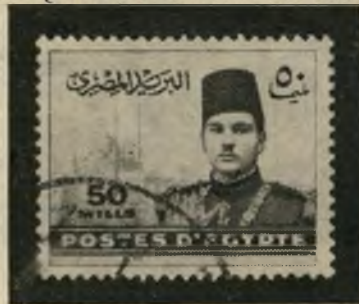
3. פרוק הצעיר נער יפה-תואר

אז, כמו היום, פנתה הגאווה הלאומית המצרית לעבר העבר הרחוק. דיוקנה של המלכה נפרטטה (בול 4) הוא סמל העבר הטרום-ערבי של מצריים העתיקה — שנדחק במידה מסוימת על-ידי נושאים כל-ערביים בתקופת עבד-אל-נאצר, אם כי לא נעלם כליל גם אז.