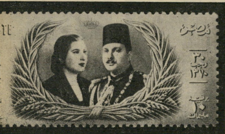
5. פרוק עם אשתו האחרונה (1951) טופה של תקופה