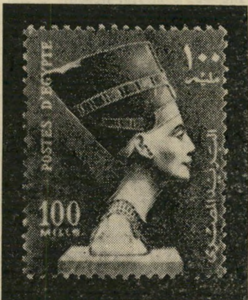
4. נפרטטה פאר העבר המצרי

בול-דואר הוא חומר העמולתי, ועל כן הוא מלמד יותר על כוונות המישטרים שהדפיסו אותם מאשר על רוח העם. אך העם השתמש בבולים והתחנן עליהם — ולא-פעם מקפל הבול הקטן בתוכו סיפור שלם.