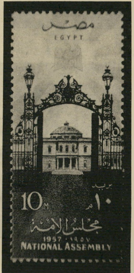
2. בניין מועצת-האומה תקופת-הזוהר של נאצר

חובבי הבולים יפנו, מן הסתם, אל הדור כנים הרבים המציעים מעטפות של בולים מצריים, בזיל-הזול. האספנים ידביקו אותם באלבומיהם. אך גם מי שאינו אספן, כדאי לו להעריך מבט בפסוק-הנייר הציבעוניות האלה, כי ניתן ללמוד מהן הרבה על אופיו של עם ועברו.