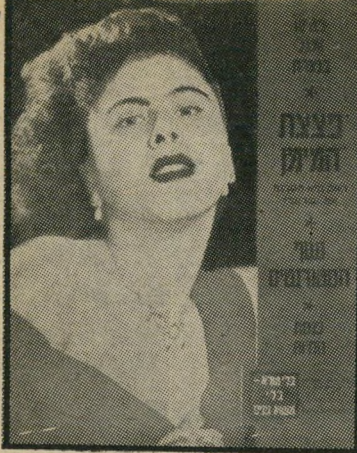
"העולם הזה" 861 תאריך: 22.4.54

כתבה מצולמת ומפורטת לרגל יום השואה והגבורה, שהוכיח תרה, "וארשה 19 באפריל 1943", תיארה את עמידתו של גיטו וארשה ואת הניסיון הכושל להגיש את הגיטו כמתנת יום-הולדת לאדולף היטלר. הגיטו החויק מעמד בגבורה עוד כשלושה שבועות.