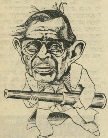
ז'אן פול סארטר