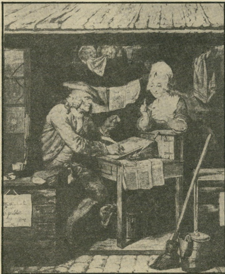
תחריט גרמני מימי-הביניים על סופר העיר דירת שרד ומשכורת חודשית

* אין סיבה שהמדינה תסבסד סופר וחוק ומבוגר כאהרן מגד במענק-יצירה. מענק-יצירה חייב לתת סיכוי לסופרים צעירים ולא לסופרים שמיצו במשך שנות דור כל סיכוי שניתן להם על חשבון משלם המיסים.