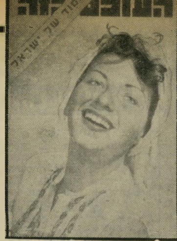
"העולם הזה" 860 תאריך: 15.4.54

גיליון "העולם הזה" שראה אור השבוע לפני 25 שנה בדיוק, הקדש רובו ככולו לדור החדש של ישראל. הטילה לגיליון מיוחד זה: מלאו ארבע שנים לקיומה של המערכת הנוכחית (208 שבועות רצופים). במרוך "קורא יקר" ציינה המערכת, בין השאר: "הרבינו למתוח ביקורת ב־208 גיליונות אלה. היתה זאת תמיד ביקורת חדה, חותכת, לעניין. ניצלנו את איטלינתו מלוא־הניצול. לא פתמנו את פינו לא הפחד מפני הגדון לים ולא הפולחן לשקרים מוסכמים... ראינו את הליקויים וקראנו עליהם תגר. אולם לא שכחנו אף לרגע קם, כי מעבר לכל הליקויים ישנה עובדת־יסוד גדולה, השוכה עדי־אין־ערורך מכל ענייני היובלים — מיבצעי־החיים של עם חדש המכה שורשים בארמת מולדתו. מאתי־אלפי שורשים במאות־אלפי נירים. זהו היעד שאסור לשכחו מרוב עצים פגומים... "