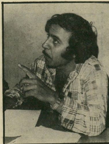
כתב חלבי אתמול התלוננת —