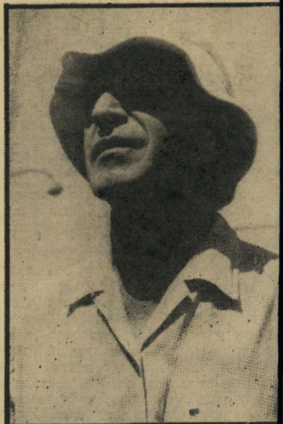
טלפיר, 1962 בעשר אצבעות