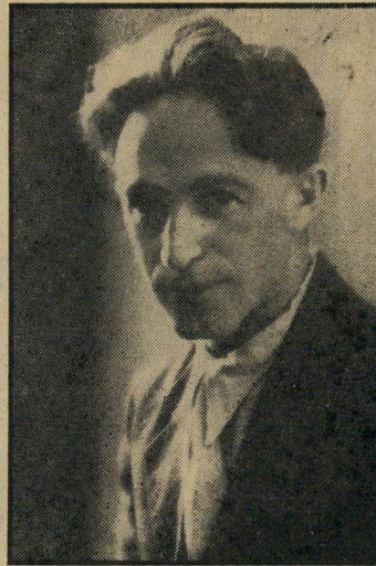
טלפיר, 1934 חניפים תרבותיים