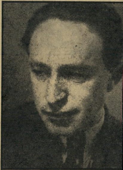
טלפיר, 1937 פירסונים ושערוריות