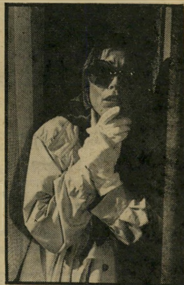
קלר מחליפה דמויות החורבן של עצמה