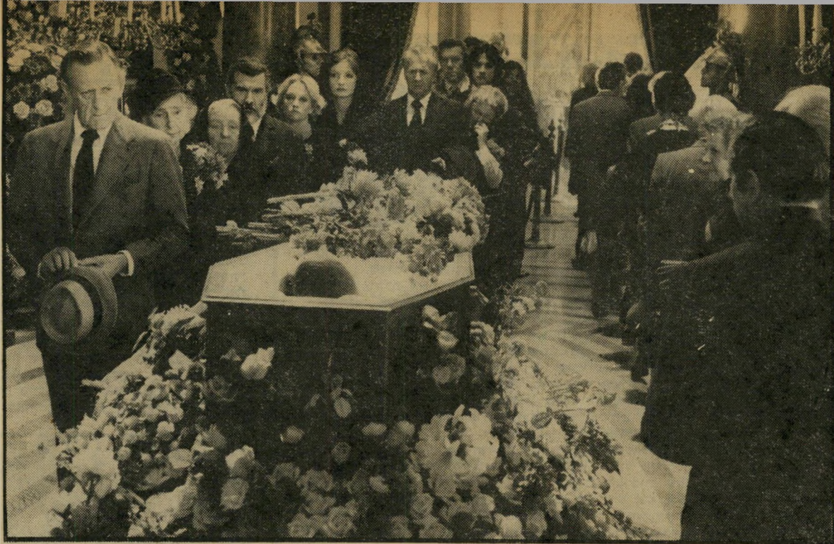
מעמד הפתיחה של פדורה: הלווייה של כוכבת משהו בין גארבו האלוהית לדיסטרין האגדית