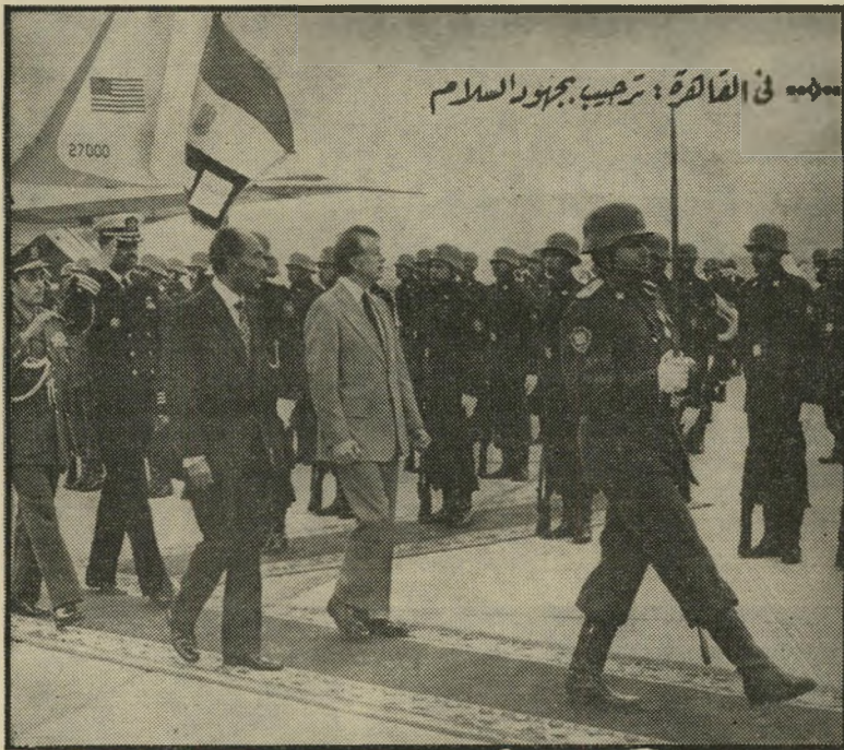
קארטר סוקר את המישטר הצבאי המצרי - אותה פלסטין

והשינוי, לשם חתימה על חוזה-השלום. וזאת, כי לדעתם קיים מחסום בחוק הקובע, שברגע שנשיא-המדינה יוצא את גבולות הארץ אין הוא יכול להשתמש בסמכויותיו, מה שאין כן ביחס לראש-הממשלה.