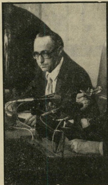
ח"כ משה מירון מיליונר סודי