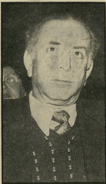
ח"כ תופיק טובי שכר, לא פלש

ר־הבריאות אליעזר שוסטק נחשב כאחד האנשים הצנועים בכנסת. הוא מתגורר בווילה ברמת־גן, ונוסע מדי יום ביומו מרמת־גן לירושלים במכונית־השרד הממשלתית שלו.