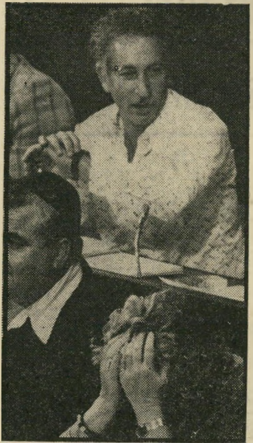
ח"כ אימרי רון 2000 לירות ואסקורט

המשק משלם את כל הוצאותיה של שטרן קטן. את הוצאות הביגוד המיוחדת, חברת הכנסת, את הוצאות המוניות המיוחדות, את הוצאות המשק. תמורת הצ'קים של המשכורות שלה מקבלת שרה שטרן קטן כל הוצאה שהיא דורשת מהמשק שלה. היא אינה זוכרת כמה כסף היא מקבלת כל חודש, אבל אני מקבלת כמה שאני צריכה. כל חודש זה משתנה. כל חודש הוצאות שלי הן אחרות. המשק משלם את כל הוצאותיה של שטרן קטן. את הוצאות הביגוד המיוחדת, חברת הכנסת, את הוצאות המוניות המיוחדות, את הוצאות המשק.