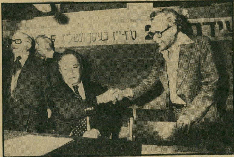
שדוהן הנשיאות בוועידת הסופרים* (1977) איש אינו יודע כמה מיליונים גולגול