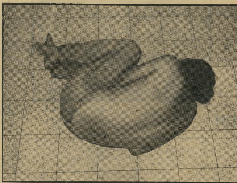
התגלגלתי על הריצפה כדי להתפכח...

"בדירה, כאשר גילגלתי את הסיגריות חשתי שהחשיש רך יותר מרגילי ובשעת העישון היה ריחו חריף מאד. אני עישנתי