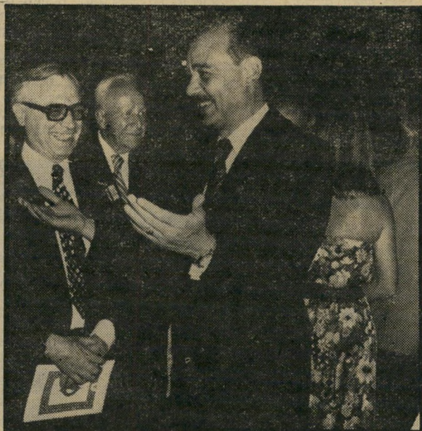
אל-גאמסי הופעה פיתאומית מחדש

מאז המהפך, התאפק אבן מלערוך את קפות חריפות מדי על ממשלת-הליכוד. יחסיו עם שר-החוץ, משה דיין, קרירים, אך קורקטיים. אבן ודיין אומנם השמיר ובהנאה הדדית רבה, אך שניהם אנשים מפוכחים, המסוגלים לעבוד ביחד. בגין מעריך את כושרו המיקצועי של אבן, ש-היה שר-החוץ בממשלה שבה ליהן בגין כשר-בליטיק.