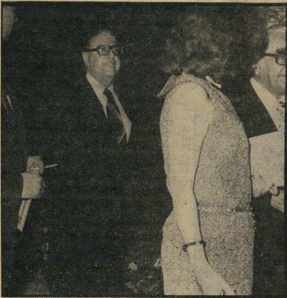
אבן ישיבה ליד אותו שולחן

יש השוללים את המועמדות. יוצאי מצריים היו מעדיפים שגריר ממוצא יהודי-מצרי. לדעתם, יוכל איש כזה להשיג פיע חום ולרכוש לבבות בהתנהגותו האישית, בעוד שאבן נחשב כאיש שכוחו בתיאוריה, אך החסר חום אישי. אך בהעדר מועמד בולט מקרב עדה זו, נראה כי אין מתחרים רציניים לאבן.