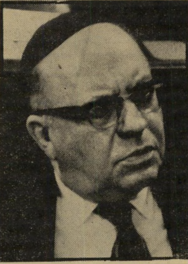
השר בורג משלים