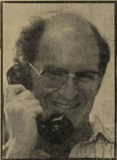
היועץ זמיר מושפע

אולם שמיר חרג מסמכותו מבחינה את-רת. המערך ושיי העלו הצעה לסדר-היום, שעל פירושה של הצעה לסדר-היום הוא, שעל הכנסת לדון אם לדון בהצעה, להעביר אותה לוועדה או להסיר אותה מסדר-היום, רק תכנסת, ולא היו"ר או הנשיאות שלה, סוברנית להחליט באיזה נושאים היא דנה. שמיר נטל לו סמכות לא לה, בהחליט, תוך שהתפתח עמם נטיית הכנסת, שלא לדון בהצעה לסדר-היום של המערך ושיי. יתכן שבכך הגדיל את מספר האישים החייבים לשקול אם ראויים הם להמשיך ולכהן בתפקידים ממלכתיים.