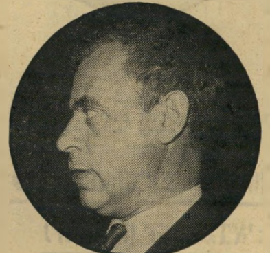
בקר „כוכב יחיד”

„אני חושב שהוא יכול להשיג הרבה יותר אם הוא לא היה גולש לרגשות-יתר, „אובר אקטינג”. אם היה יכול קצת לרסן את הפאטוס שלו, היה יכול להיות גם שחקן דרמטי טוב וגם קומיקאי טוב, אבל הוא גולש. אני חושב שמה שקרה לו, זה שאם היה רק ראשי-ממשלה ולא היו קורים כל המאורעות ההיסטוריים וההיסטריים האלה הוא היה נשאר בסדר, אבל הוא מרגיש כאן שגפל עליו כל-כך הרבה בשנה האחרונה. הוא מרגיש את ההיסטוריה על הכתפיים ו-מדבר קצת בשם ההיסטוריה. צריך להתחשב בזה. הוא כמו סטאטיסט קטן שפיתאום