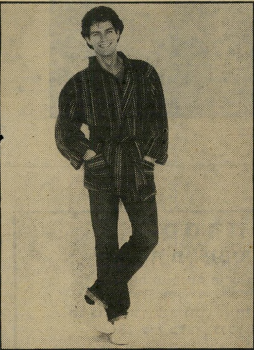
ז'קט מפוספס של סרג' אולייל