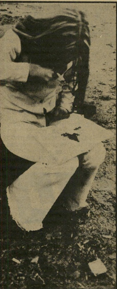
הכנת סוגריית השיש על המישטר — צפע ארסי

(המשך מעמוד 73) הנוכחי מכיל הרואין, שהוא הקטלני ביותר. המרוכז ביותר והיקר ביותר בין הסמים הקשים. גרם אחד של הרואין מספיק לכ-16 מנות. מחירה של מנה כזו היום נע בין 800 ל-900 לירות. הרווח העצום הכרוך בהברחת ההרואין ובמכירתו מהווה פיתוי גדול לסוחרים סמים. מה גם שבגלל מישקלו הזעום ונפיחו המצומצם, קל יותר להבריחו מאשר את סוליות החשיש המסורבלות. ועוד יתרון לו — לגבי סוחרים סמים — הוא גורם להתמכרות מיידית. טעימה אחת ממנו והאדם מכור לסם. הריפוי מהתמכרות זו כימעט בלתי-אפשרי. שיעור הנרפאים ממנו, כפי שידוע היום, מגיע במיקרה הטוב ביותר לכדי 2%. ההרואין והקוקאין מופצים בעיקר במרכז הארץ. הם כימעט שאינם מוכרים בכפרים הערביים ובדרום הארץ, מפאת מחירם היקר. עתה נראה, לפי סימנים בשוק הסמים, כי הקשר החדש, שמקורו או בהולנד או במזרח-הרחוק, יתמקד על סמים קשים. המישטרה הצליחה ללכוד לפני כשבוע עיים צעיר, שהבריח מהולנד לישראל 38 גרם קוקאין. הוא הטמין אותם בקופסה