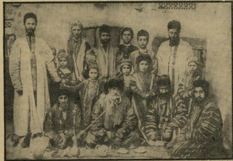
מישפחה גרוזינית במוף המאה הי"ט בגרוזיה המיסחר היה פשע

אלה היו הדרכים הרגילות לפרנסה, כולן היו כרוכות בעבירה על חוקי המדינה. לכן הפכו לגורמות חברתיות מקובלות.