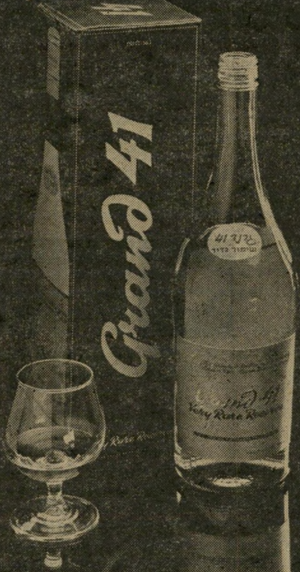
גרנדי 41 ברנדי מעולה עם המוניטין והמסורת של יונת אשקלון