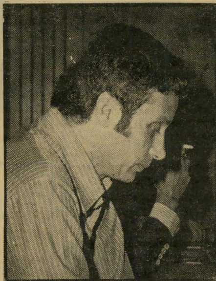
מנהח גורן שני מנהלים

המישטרה הוועקה למקום, עצרה את בעלי הכר־טיסים, התברר כי הם קנו אותם מצעיר שהתמקם ליד בנייני האומה ב־200 לירות האחד. השוטרים מיהרו למקום ומצאו את הצעיר כשהוא מוכר את