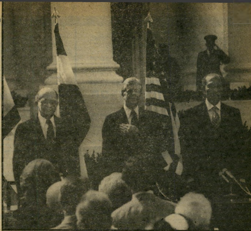
יד על הרב מנחם בגין, גימי קארטר ואנוור אל-סאדאת ניצבים דום בחזית הבית הלבן, כשמאחוריהם מתנוססים דיגלי מדינותיהם שפתחה את טכס הסכם השלום בצהרי יום שני השבוע.

מרות הציונות , מסע הספקנות וזריעת החרדה, נצבט ליבו של כל מי שחזה בטכס חתימת הסכם השלום בין ישראל ומצריים. הסרה אולי התרוממות הרוח, אבל התחושה של שותפות לרגע היסטורי פרצה אפילו מתוך המסכים. החתימה עצמה היתה הישג, שרבים לא האמינו כי יהיו עדים לו. אבל היא היתה אקט מיכאני. את תחושת ההתעלות היו