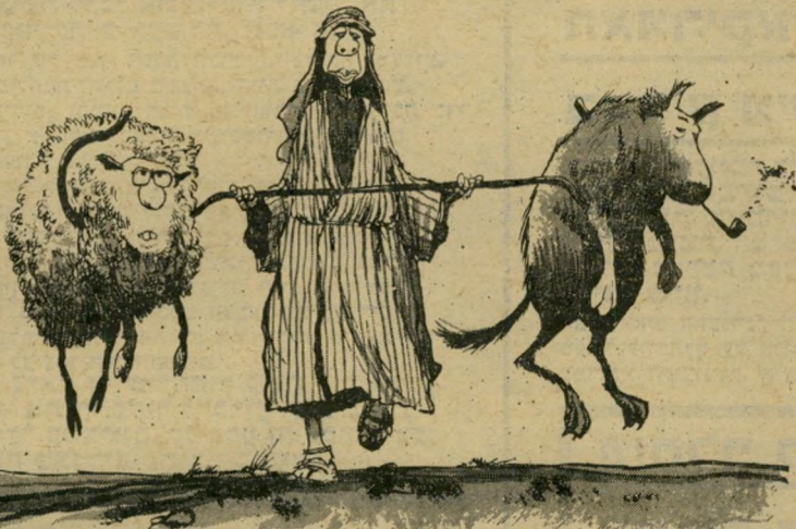
„וגר זאב עם כבש, ונער קטון נוהג בהם!“

אנוור אל-סאדאת מרגש פחות בעת שהוא קורא את נאומו מהכתב באנגלית. מאשר כשהוא מגמגם, מהסס ומזיע בחיפוש אחי רי המילים המתאימות. פנייתו בפתיחת נאומו אל הנשיא קארטר והתעלמותו מ"מנחם בגין, תוך אי איזכור שמו, סיפקו חומר לפרשנות בדבר יחסו האישי אל בגין. לא פחות מכך היתה משמעותית התעלמותו מהנושא הפלסטיני, שנכלל בי נאומו הכתוב אשר חולק לעיתונאים. בי נאום הכתוב היתה פיסקה שהופנתה אל הנשיא קארטר, שבה נאמר: „איש אינו ראוי יותר לתמיכתך מאשר העם הפלסטיני. את ההמשך כדלהלן השמיט אל-סאדאת. „הוא זקוק להבטחה ולעזרה כדי שיוכל לנקוט