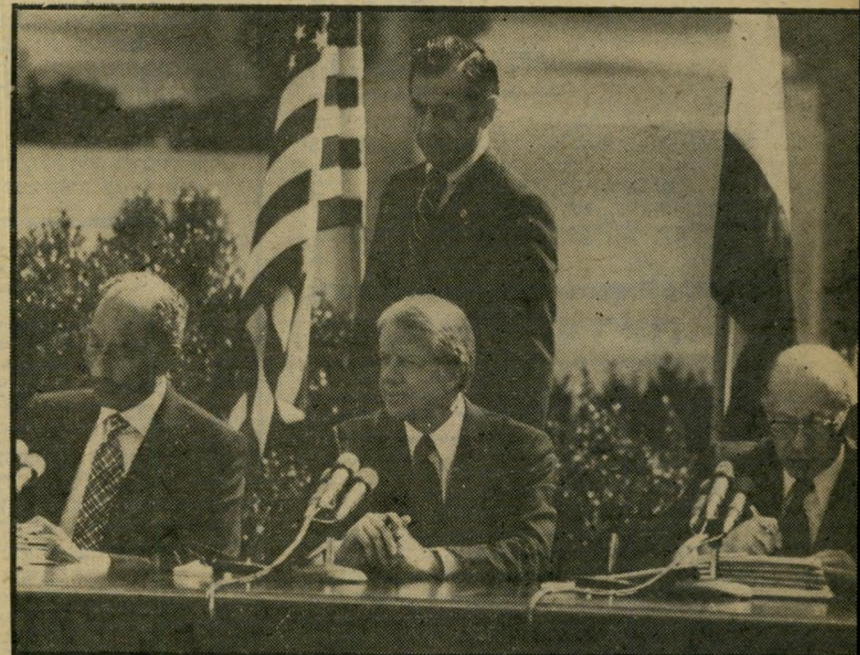
זה הרגע מנחם בגין ואנוור אל-סאדאת חותמים על נוסחי הסכם השלום שהודפסו באנגלית, עברית וערבית. התיקים עביי-הכרס מכילים גם את המפות השייכות לנספח הצבאי של ההסכם. כשעט בידו ממתין קרטר לתורו לחתום.

צריכות להעניק לה המילים שליוו אותה. נאומיהם של שלושת השותפים להסכם: הנשיאים קארטר ואל-סאדאת וראש-הממשלה מנחם בגין. זה היה צריך להיות הקליימקס של המעמד שתוכנן כמיבצע ראווה. הקרשצ'נדו של סימפוניית השלום הבלתי גמורה. שלר שת גיבורי ההצגה הכינו עצמם לרגע זה. שלושתם ידועים כנואמים רבי כישרון, שהמילים הן נישקם העיקרי. אף אחד מהם לא עמד במיבחן. נאומי הם לא הלמו את גודל השעה. הם לא ילמדו בספרי ההיסטוריה ולא ימנו בין שיאי הריטוריקה. והשלום, יותר מכל עשייה אחרת. נשקל דווקא במילים. אחרי שאי אפשר היה להתפעל מהצור