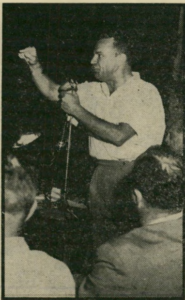
פרקליט תמיר 1965