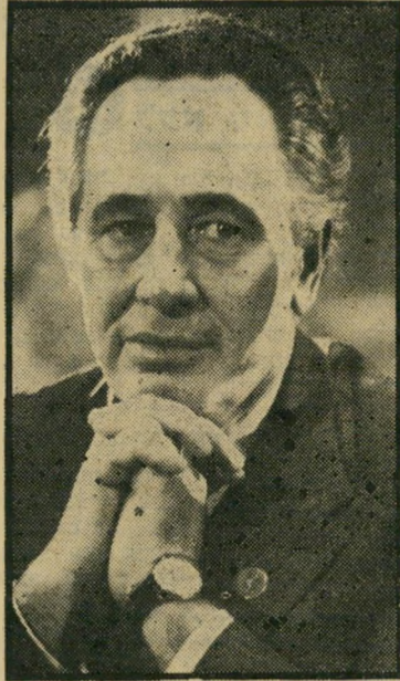
שמעון פרס עשיר מהאח

טובי נהנה מהקופה המיפלגתית העשירייה של רק"ח. לרק"ח עסקים כספיים וכל-כליים מסועפים ביותר, תחת שמות שונים.