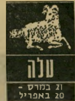
טלה 21 במרץ - 20 באפריל

החשיבות של חתומים של העיתונות והתקשורת. אל תהסס להפיק את המירב מהם. אל תהסס להפיק את המירב מהם.