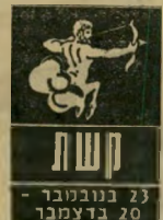
קשת 23 בנובמבר - 20 בדצמבר