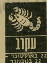
תקרב 22 באוקטובר - 22 בנובמבר