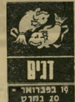
דגים 19 בפברואר - 20 במרץ