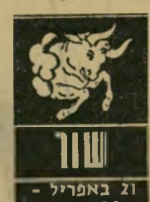
שור 21 באפריל - 20 במאי