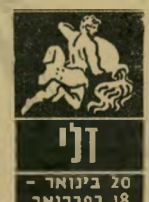
דלי 20 בינואר - 18 בפברואר