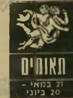
תאומים 21 במאי - 20 ביוני