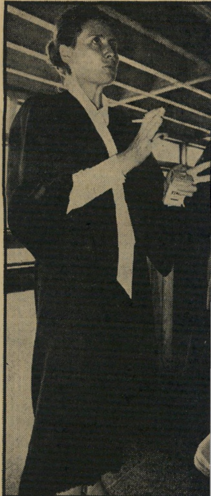
סירוטה בבית-המישפט יותר הזדהות

גבר לאשה, הכישורים הנדרשים הם כיי- שורים שבראש, ולא של חיטוב הרגליים. גם האווירה הטובה, השוררת במקומות מסויימים בפרקליטות, מושכת את האנשים לקשור את גורלם בתביעה. העבודה נעשית, ואם הופכת התביעה הכללית יפה יותר משנה לשנה, מי יתלונן על כך?