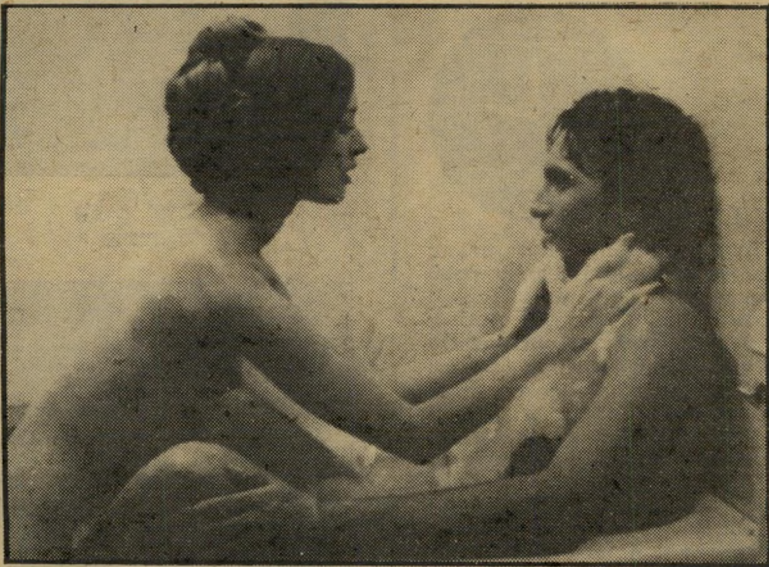
קאמדי קיטון וארון תבור באמבט הוואמפ הפכה למוהל