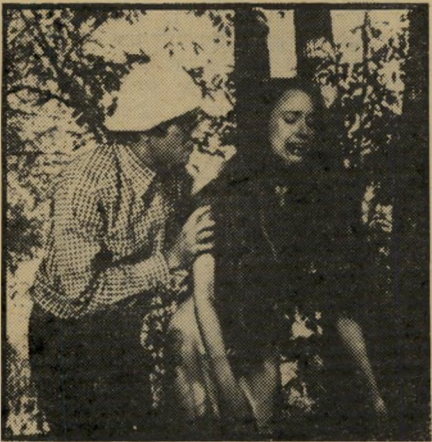
סוטה מנחם נאנסת לפני ואחרי

מסתבר, לאחר ראיית הסרט, שלא רק אנשי הצנזורה לא ראו את הסרט עד תומו. גם עיתונאים ומבקרי-קולנוע, שבאו השבוע להקרנת-מחאה בקולנוע גורדון,