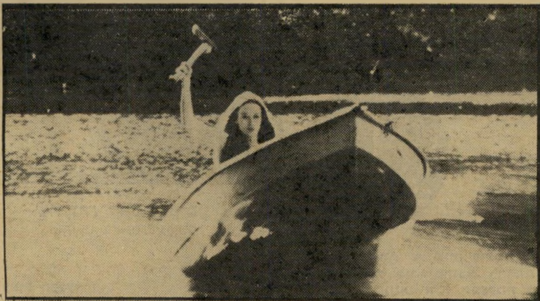
קיטון בעיקבות הקורבן האחרון ניקמת הגרון המתהפך

עלמה למוהל, שולפת סכיני-מיטבח ומנסת רת מתחת לפני המים את מכשיר-העוללה הגברי. נו, מה אפשר לעשות — אם אור שימה היפאני, להבדיל, הראה מעשה מסד מרישע זה באימפריית החושים שלו — מדוע אסור למאיר זרחי? חבל לצאת למילחמה בצנזורה בגלל מוצר מפוקפק שכזה. מוסד הצנזורה עייף וזקן וצריך לחלוף מן העולם, ויש לתת חופשי ביטוי לכל אמן וחופשי-שיפוט לקהל מבור גר. אבל כשהדגל למילחמה הוא גועלי-נפש, קשה לשכנע מישהו בצידקתה.