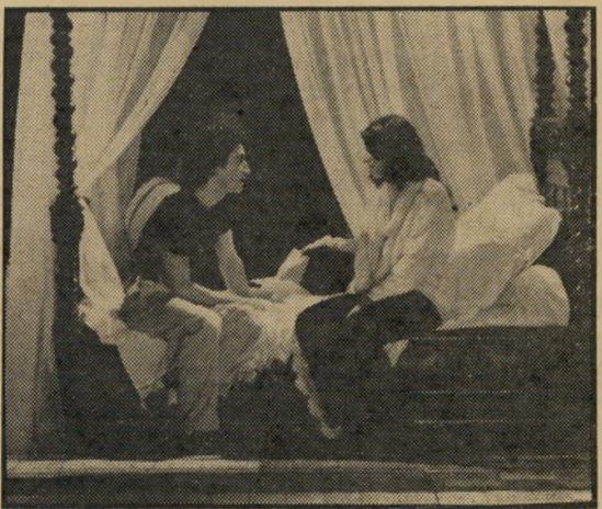
איימה וברי: מחלה פוטוגנית

התרגשות, זעם, קינאה, אהבה, צער, הכל מועבר לצופה באמצעות סצנות שקופות ושיגרתיות גם יחד. הבן הזועם הולך להכות בשק אימון למתארגנים, האשה הנואשת מחו' סר ההבנה של הבן הולכת ליד פסי הרכבת התחתית, הסוף המר מתבשר בסצנה מתוך לה טראוויאטה. הצלילים של מישל לגראנג נמרחים בתנופה גדולה, וצילומיו של ברנר יצרמן אופפים את התיפאורה ואת הדמויות בערפל רו' מנטי וחמים.