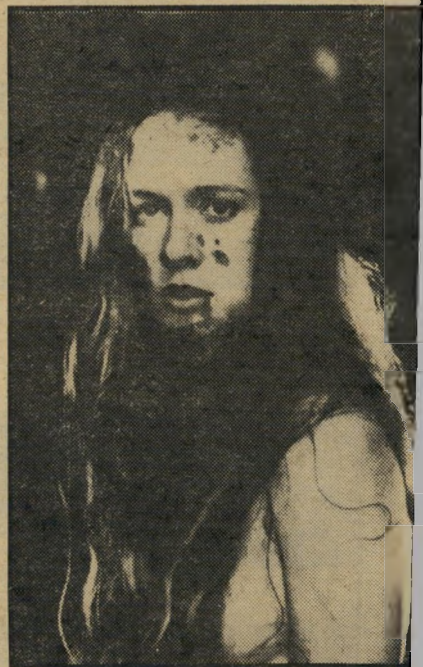
שחקנית קאמיני קיטון מתוקה כאונס הנקמה

הגיוון להטות לו און, לבדוק במה מדובר ולראות הכעצקתה. המדובר בסרט עלילתי בשם יום בחיי אשה, שלדברי מפקיו מוסס על מיקרה אמיתי. עיתונאית בעלת יומרות סיפרותיות מתבודדת בביתיקי בעיירה שקטה, בתיקי וזה לכתוב את יצירתה הרצינית הראשור נה. במקום השראה יורדים עליה ארבעה צעירים ואונסים אותה באכזריות. היא מת' נקמת בהם.