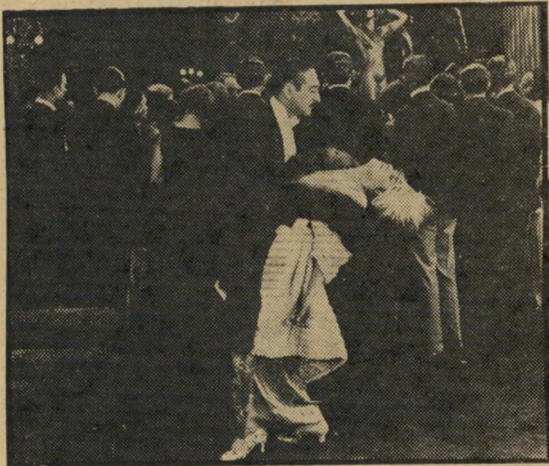
מנז' ופרוביינס: מוסר בורגני

בקיצור, זה נראה כימעט כמו רומן למשרות. זאת, אילולא המבט המפוקח והחריף של צ'פלין על החברה ועל הדמויות, שהוא כופה עליהן אנושיות שהיא זרה בדרך כלל לרומנים כאלה. האהבה היא רגש נאצל, אבל הנר' חיות, הרווחה וחיי-הזוחר לא נופלים ממנה, בעיני האשה המצויה. הצייר הרומנטי הוא אולי צעיר ונאה, אבל כשה' רוונתיו האמנותיים מפוקפקים. הוא אינו מסוגל להחליט בעצמו מה הוא רוצה, ולאהבתו יש גבולות ברורים מאד של מוסר בורגני. הרווק העשיר והמבוקש צריך להיות