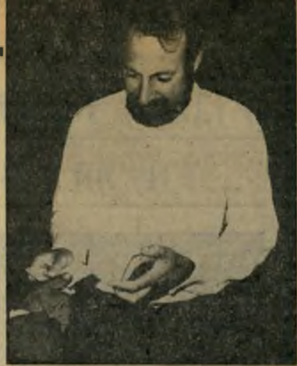
ח"כ עקיבא נוף

ח"כ עקיבא נוף דואג לתדמיתו היציבורית. ח"כ נוף רוצה כי הוא יסמל בעיני הציבור את היושר האישי והמוסר, ולשם כך הוא עושה פעולות רבות. מדי פעם הוא נזקק לעזרת בית-המשפט כדי שזה ישמור על שמו הטוב. חלק מדיוגים מישפטיים אלה מתפרסמים, חלק אחר אינם מתפרסמים. לפי בקשת נוף ובהוראת בית-המשפט (ראה עמוד 2).