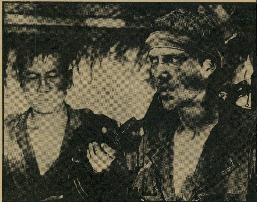
ניק (כריס טופן וולקן) בשבי הווייטקונג כיצד להישאר בחיים

תשובתו של צ'ימינו: "סירטי אינו ריי אליסטי. זהו סרט סוריאליסטי. אפילו הנוף הוא כזה. למשל — את העיירה שבה חיים גיבורי הסרט שלי, הנקראת קליירטון, הרכבתי מדמותן של שמונה ערים קטנות ודומות זו לזו בארבע מדינות שונות בארצות-הברית. את קליירטון עצמה אי אפשר למצוא על המפה. גם הזמן אינו מחושב על-פי הזמן המציאותי של התרחשויות. בכונה לדחוס ניסיון של מילחמה לתוך סרט, אפילו ארוך כמו שלי, (184 דקות) היתי חייב להפליג מן המציאות. אם מת-