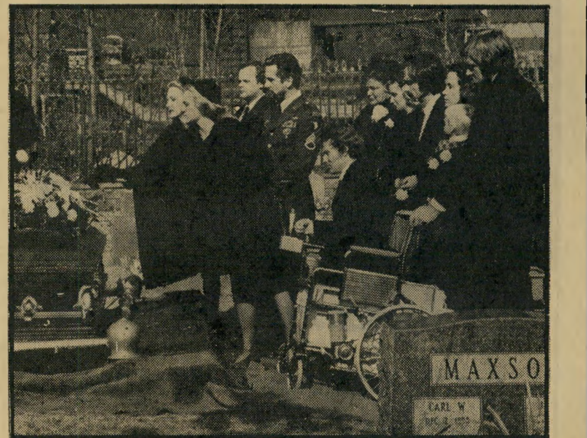
הסוף: טבח הקבורה של ניק ניפון האשליות