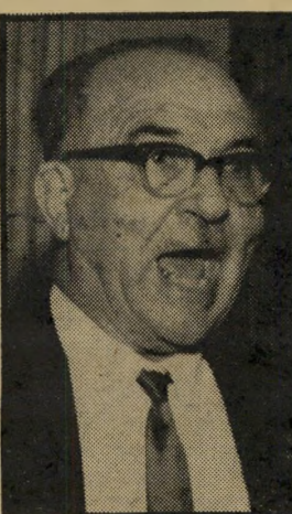
לוי אשכול שעה 9.30

עשר השנים שחלפו מאז פטירתו של ראש-הממשלה השלישי של מדינת ישראל הן זמן מספיק, ואף רב מדי, כדי לשר כוח את אלה ששנאוהו, שבזו לו ושרדשו את הסתלקותו מכס ראש-הממשלה. כאשר פרש דוד בן-גוריון ב-1963 הוא אמר על אשכול: "הוא לא יורש שלי, זה מגיע לו בזכות עצמו." אולם ב-1965 אמר ארנון צוקרמן על אותו אדם, כי "יש להשחרר את ישראל מהמישטר המושחת והמטומטם" שבראשו הוא עומד. הוא אף כינה את אשכול "שקרן" ו"פחדן". נשות-הינדור-העליונות שיהררו את תיק הביטחון מידיו של אשכול, לאחר שהשיע את הגימגום המפורסם, ערב מילחמת ששת הימים, ל' העניקו אותו למשה דיין. ה' מפיק יהודה קורן והבמאי אלי