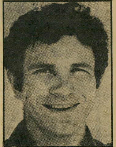
מפקד-מיבצע יוני "הבה נצוד ארנבות!"

בחודש מארס עומדת ההוצאה ויידנפלד את ניקולסטון להוציא לאור, סוף-סוף, ספר על מיבצע אנטבה, בשם יוני, גיבור אני טבה. הסיפור שמאחרי פירסום הספר מטיל אור על היחסים בין "לורד" ג'ורג' ויידנר פלד וממשלת ישראל. יוני וכו' הוא הביוגרפיה של אלוף-מש-