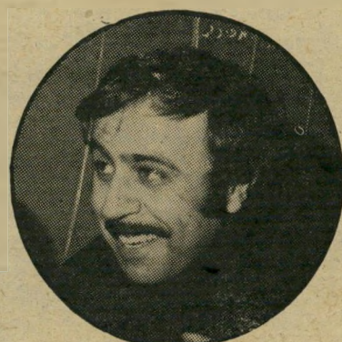
כתב חלבי התלמידים זיעזעו