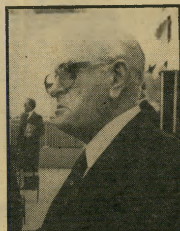
שר אוצר ארלוך מתנה מגרמניה

למרות התוכנית שהופקה בחוברת מהיר דרת, מפקקים ראשי הטלוויזיה, אם אומנם תצליח רשות-השידור לבצע אותה, מפני שלדעתם התוכנית אינה מציאיתית, והיא חישובים שבה אינם נכונים. תירכש חוליית מיקרוגל, שתחבר את רמות עם המיבנה הישן של הטלוויזיה, ויירכשו פריטי-ציוד קטנים בסכום של 150 אלף דולר.