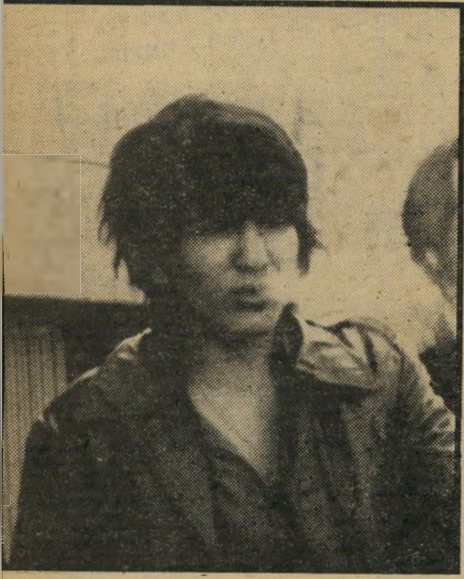
אושרוף אחרי העדות הרוצחים אמרו: "דפוק בו, דפוק בו"

טוואשי כבר בדרכו לבית-החולים, שמע את נאדיה מדברת על פונטיאק ותיקן אותה. תוך כדי מתן העדויות נתגלו וחזרו והופיעו שמות שונים של אנשי העולם התחתון ביפו המעורבים בעיסקי סמים, ואשר ניסו לרצוח איש את רעהו, או נאשמו בדקירות ותקיפות הדדיות, עד שהשוטפ בנימין כהן אמר לתובע: "אתם לא תשאירו אבן על אבן ביפו."