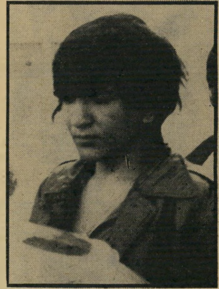
אושרוף בדרך לעדות פארוזיה על סרטי בלשים

מחצית הקהל באולם קרובי הנאשמים והמחצית השנייה אנשי מישטרה בלבוש אזרחי