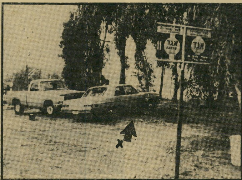
מכונית הדודג' הרצחנית במקום שננטשה בכפר-שמריהו שרידי-צמחים על הגוף

פסק-הדין בתיק מיוחד זה תלוי כימעט כולו בהתרשמותם של השופטים מהעדויות הטכניות-ניסיוניות שניתנו במהלכו. אפשר לאמר כי תוצאת המישפט תלויה בזיהוי השערות שנמצאו בוגוגית המנופת של המכונית.