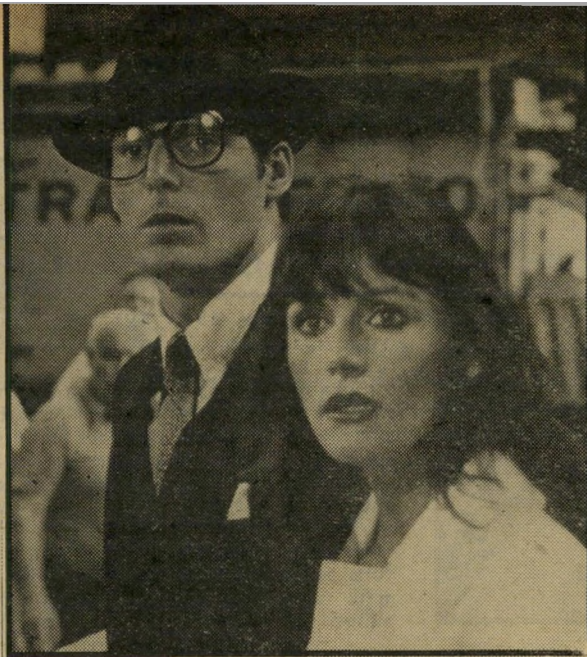
שחקן ריב כסופרמן