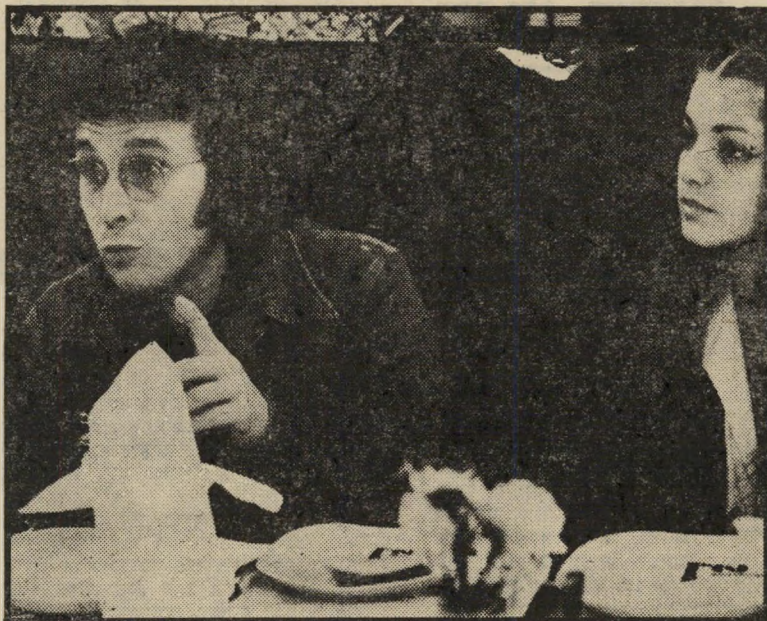
אורלי צרפתי דון מקליין מיכתבים מלב אל לב

לא תאמינו, לא תאמינו ושוב לא תאמינו, וכל זה למה? מפני שגם אני כש' שמעתי לא האמנתי, ובכן, היכוננו לחדשה: דון מקליין, הזמר האמריקאי הידוע, מת' חתן בשעה טובה, ולא סתם, אלא עם ישראלית. הסיפור החל בימים הטובים כ'