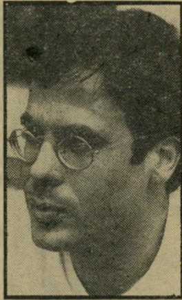
שארה: שדו שעה 5.30

עטלפי עכו (5.30). קוראי מעריב מתקשים לקרוא את מדורו השבוע של בנימין גלאי, על קפה הפוד, אולם הי- נערים המשתתפים בחידון שארה של זמן יתמודדו בהצי- לחה עם סיפרו עטלפי עכו. בי-