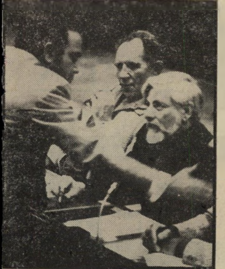
השר פת מברך אותה בעייה — ביתר חומרה

כך הפך העולם הזה העיתון היחיד בעולם, שנתן שמו לסיעה פרלמנטרית. בחירתו של אבנרי לכנסת הביאה למאבק עיתונאי-פרלמנטרי משולב בכל הנושאים, הפרשות והמאבקים הציבוריים שבהם עסק העולם הזה. היא הגבירה את כוחהמחץ והתהודה של גילויי העיתון. המערכת תר'מה ליעול עבודתו הפרלמנטרית של נציג'ה בכנסת. פעילותו הפרלמנטרית של ה'נציג בכנסת הגבירה את השפעת פירסומי העיתון. אבנרי היה לא רק נציג העולם