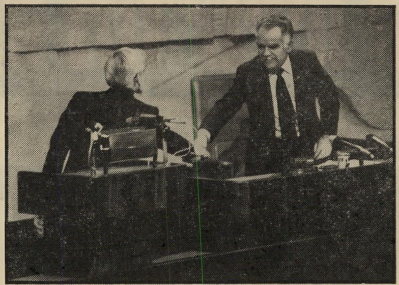
לחיצת-יד ראשונה מאבק עיתונאי-פרלמנטרי משולב

חזרתו של אבנרי לכנסת התשיעית הציבה את המערכת מחדש לפני אותה בעיה, ביתר חומרה. הפעם אין אבנרי מייצג בכנסת את העולם הזה אלא את מחנה של"י, שהוא פדרציה של גופים פוליטיים, שתנועת העולם הזה היא רק חלק מהם. כח"כ הוא כפוף למוסדות מחנה של"י כולה, ולהחל'טות סיעת של"י בכנסת. לא קיימת בהכרח זהות בין ציבור קוראי העולם הזה לבין חברי מחנה של"י ובוחריו. כשם שהעולם הזה לא היה מעולם ביט'אונה של תנועת העולם הזה — כוח-חדש, כך אין הוא מהווה גם כיום ביטאון של מחנה של"י או של מרכיב תנועת העולם הזה שבתוכו. העולם הזה ימשיך להיות עיתון בלתי-תלוי ועצמאי, שאינו כפוף לשום מיפלגה או תנועה פוליטית. איש אינו בודק את ציצייתיהם הפוליטיות של עובדיו, והקולקטיביות הרעיונית היחידה המאחדת אותם היא הדבקות לעקרונות העיתונות החופשית הטובה. עוד לא מצאנו את הנוסחה המתאימה לצורת הדיווח העיתונאי של אבנרי מה'כנסת. אנחנו מתלבטים בין כמה רעיונות ואפשרויות, המבוססים על לקחי העבר, שמטרתם היא אחת: למנוע את הזהות בין פעילותו הפרלמנטרית של עורך העולם הזה בכנסת לבין העבודה העיתונאית שלו ושל המערכת.