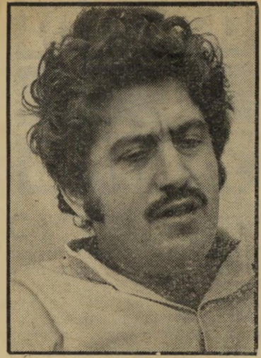
ח"כ ברעם עבודה רבה

אסעד הוא עשיר מופלג. יש לו בית בן שתי קומות על שטח של 150 מטרים, שבו הוא מתגורר עם אשתו ותשעת יל-