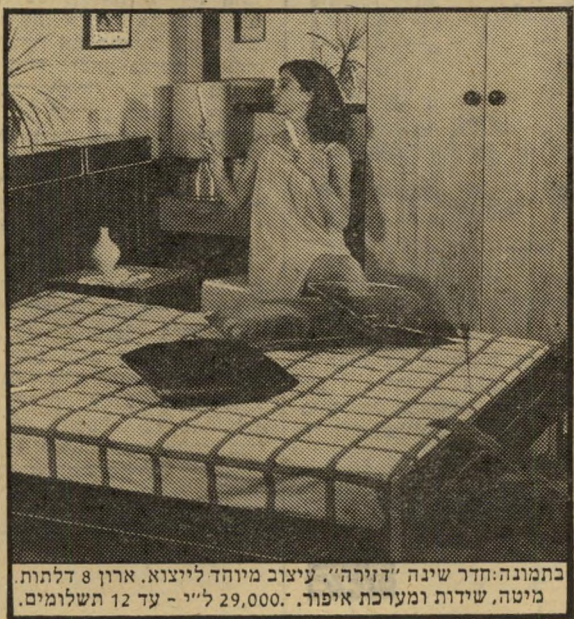
בתמונה: חדר שינה "דנירה". עיצוב מיוחד לייצוא. ארון 8 דלתות. מיטה, שידות ומערכת איפור, 29,000 ל"י - עד 12 תשלומים.

רק בדריית: שיטת "אשרהיט" - עד 12 תשלומים על כל פריט. התחדשי עכשיו - שלמי אחר-כך.