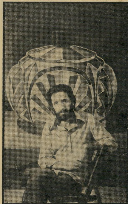
צייר בורדול'אן בושם של נשים

הזמן ראויה. עד מיבצע סיני לא ידע מישא מהי ישראל. באותה תקופה, החלו משמיצים באמצעי התיקשורת הרוסיים את ישראל, ומכנים אותה בשמות גנאי. מיל-חמת ששת-הימים חוללה מיפנה בליבו של