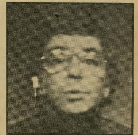
קריין ארבע מהמסך לאירוויזיון

כעבור שבוע שוחררה מבית-החולים, אך לא לפני שהבטיחה לרופאים להאיט את קצב-העבודה שלה, ובעיקר את קצב הנסיעות שלה בין ירושלים (הטלוויזיה), אילת (מקום מגורי הוריה והמקום