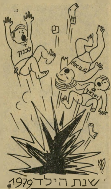
שנת הילד 1979

שנת 1979 הוכרזה כשנת-הילד-הבינ" לאומית, וכבר עם החילתה אנו יכולים להיווכח כיצד מתייחסות אומות העולם אל הילדים — של אויביהם. הקמבודים טבחו בילדים וייאט-נאמים בפשיטות על כפרים בגבול עם וייטנאם. בתגובה חיסלו הוויאט-נאמים כפרים קמבודים על הילדים שבהם.