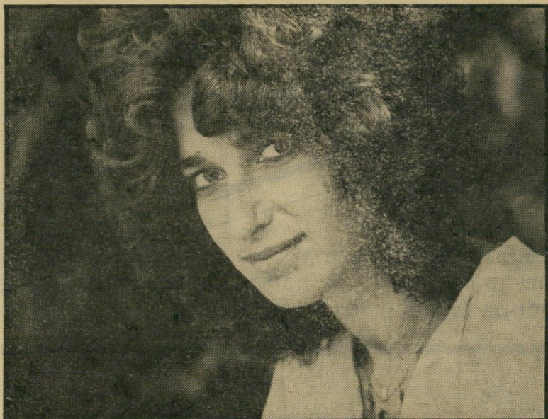
במאית קלאודיה וייל סרט על דוד קורט