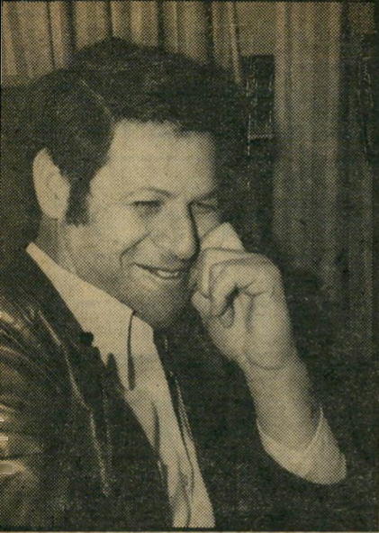
מנהל יבין על החטך