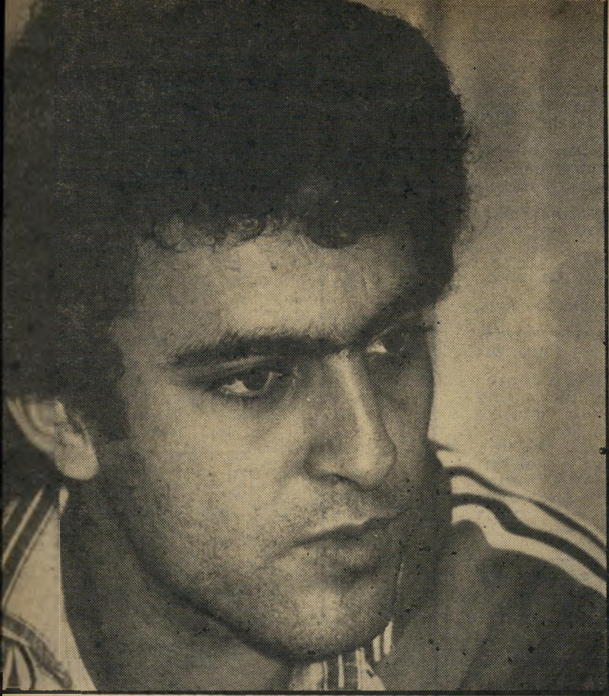
ג'מל אהמר מהאג'נה "בזכות ולא בחסד"