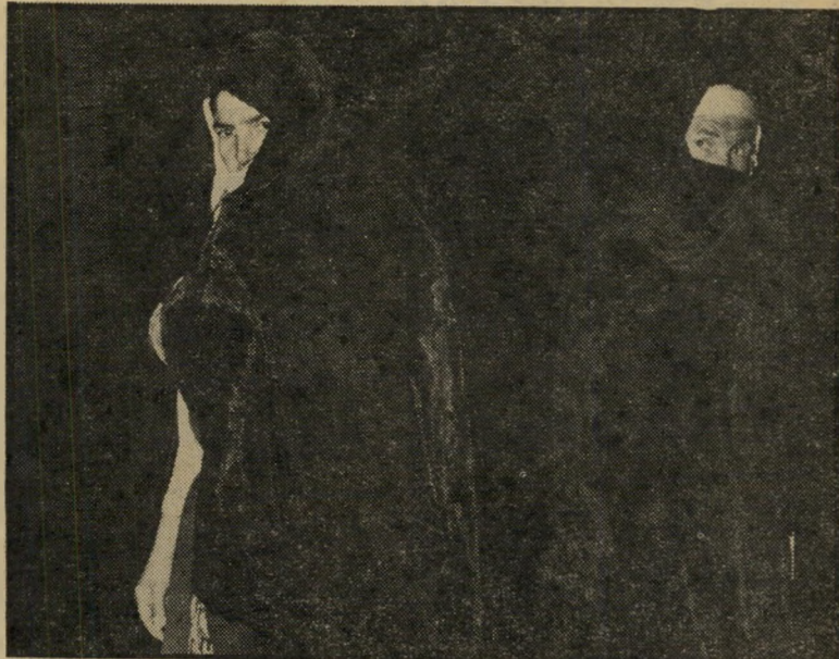
אמו ואחותו של הנאשם עודה בבית המישפט גלימת הקטיפה השחורה